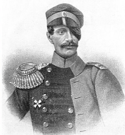
Адлерберг Александр Яковлевич

Поручик Карл Христианович фон-Турский, на могильной плите у которого написано: «...пал за Отечество 4 августа 1855 г.», погиб в Ченореченском сражении.