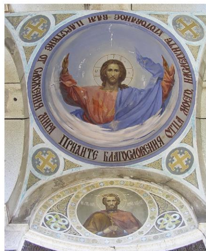
Горчаков. Интерьер часовни