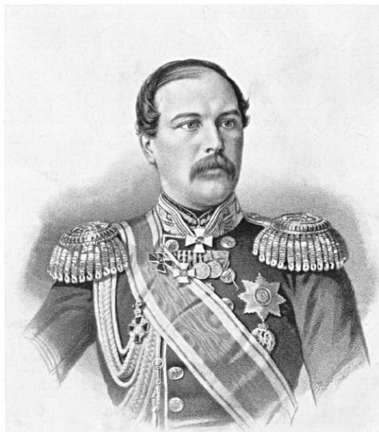
Тотлебен Эдуард Иванович